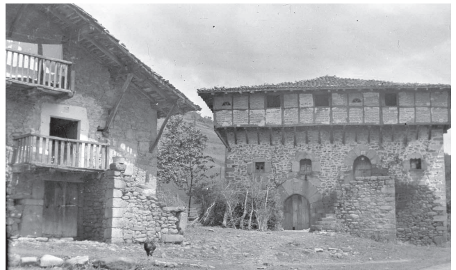
Aranguren dorretxea, Orozko, Bizkaia