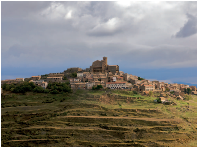
Luxue, Nafarroa / Mairaga

Analisa: Rudofskyren "Architecture Without Architects" ia mende erdi ondoren