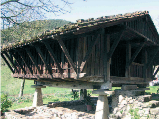
XVI. mendeko Agerre baserriko garaia, Bergara, Gipuzkoa