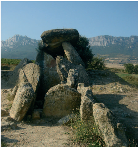
Etxezarra trikuharria, Bilar, Araba