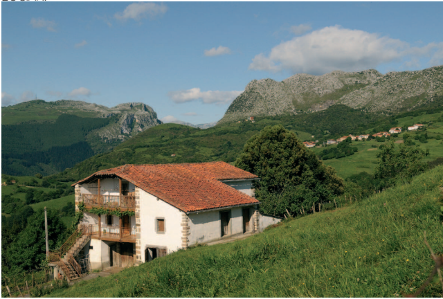
Karrantzako Santecilla auzoko baserria, Bizkaia