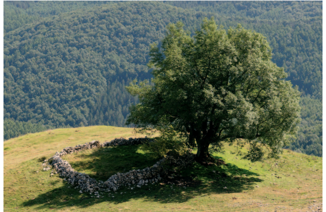
Biozkornako artegia, Aizkorri mendilerroa, Gipuzkoa