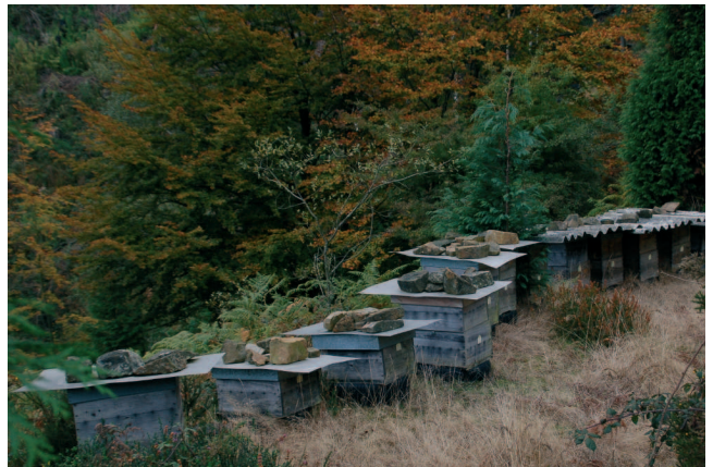
Abaraskak, Ubidea, Bizkaia