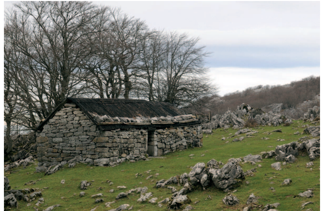
Lexardiko Borda, Itxina, Orozko, Bizkaia