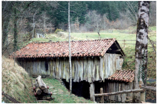
XIX. mendeko Larraondo zerratagia, Zerain, Gipuzkoa / Aran Goierrri