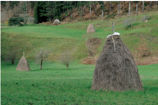
Belar-metak, Munitibar, Bizkaia