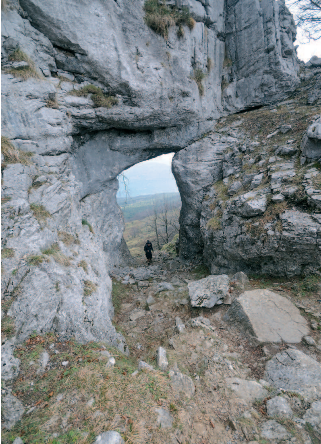
Atxulaur atea, Itxina, Orozko, Bizkaia