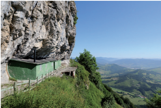
Txolopeko artzain-babeslekua, Gorobel mendilerroa, Araba / Paulo Etxeberria (CC-BY-NC-SA)