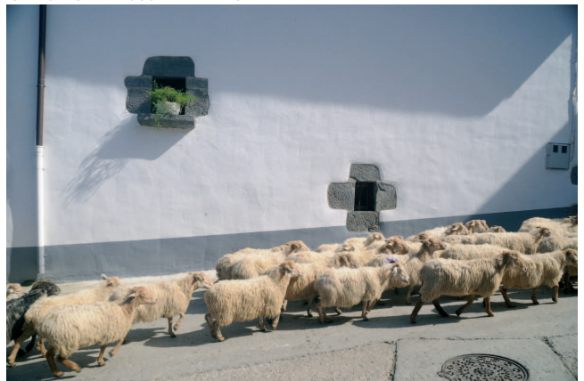
Ardiak Gaintzan, Nafarroa