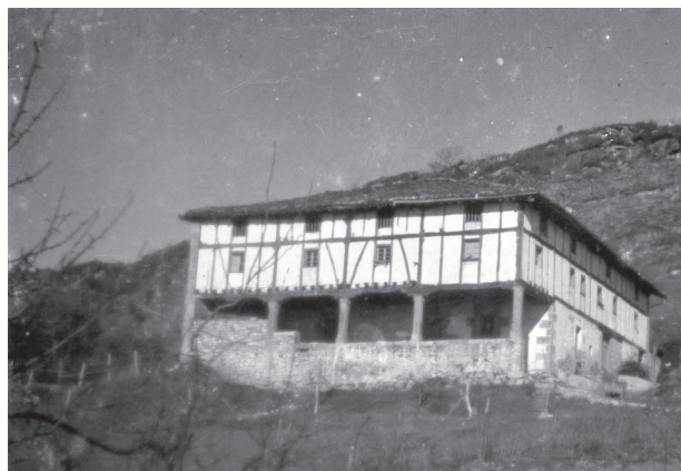
XVIII. mendeko Arrillaga Haundi baserria, Usurbil, Gipuzkoa

metodoen jatorria iraganean galdu da ”. Hitzak Mediterraneoko ohiko etxe baten argazkiak ilustratzen ditu. Berdin-berdin txertatu zitekeen Euskal Herriko baserri baten argazkia.