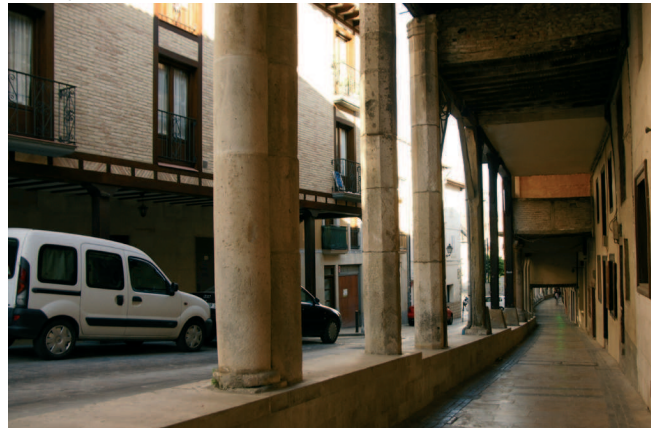
Aguraingo arkupeak, Araba / Jabrus