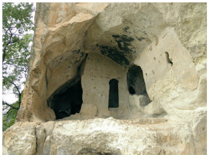
VI. mendeko Santorkaria leize artifizialak, Lañu, Trebiñu, Araba / Isabel S.