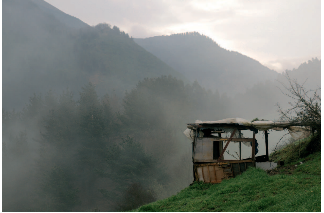
Abereentzako aterpetxoa, Gallarraga mendia, Bizkaia