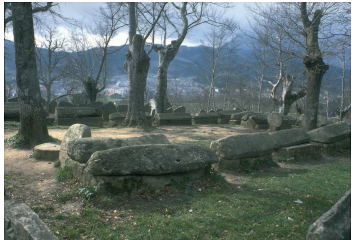
IX. mendeko Argiñeta nekropolia, Elorrio, Bizkaia