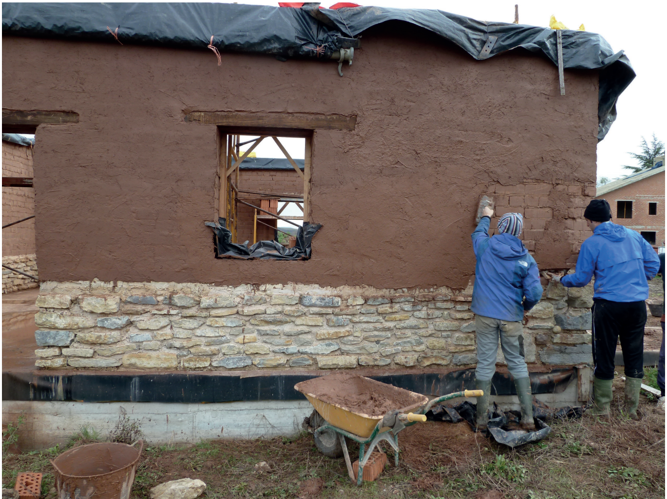
Goiko irudian ~ Egileak: Iker Lopez de Bikuña, Sandra Estebanez. ~ Lanaren zati handi bat artisau-lana izan da, harria eta lurra bezalako materialak erabiliz. Argazki honetan lagun batzuekin gaude lurraren zatiari lehenengo erreboko babes-geruza ematen.