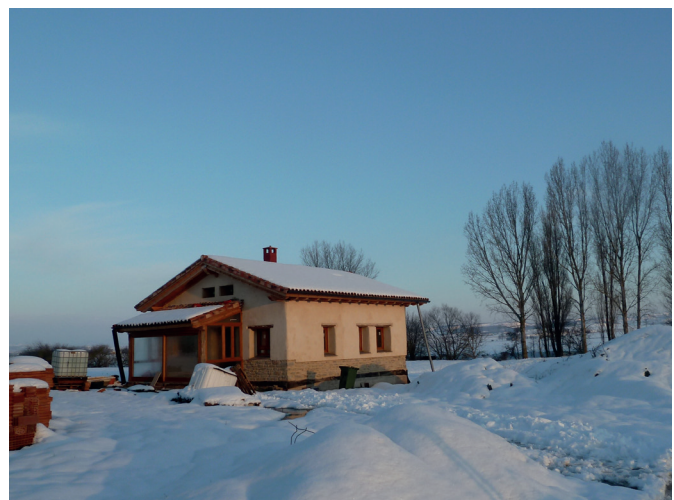
Goiko irudian ~ Egileak: Iker Lopez de Bikuña, Sandra Estebanez. ~ Etxeak inertzia termiko eta isolamendu handia du eta horregatik hotz handia egiten duen egun eguzkitsuetan, atari-aterpean sortzen den beroarekin, berogailua minimora egoten da.