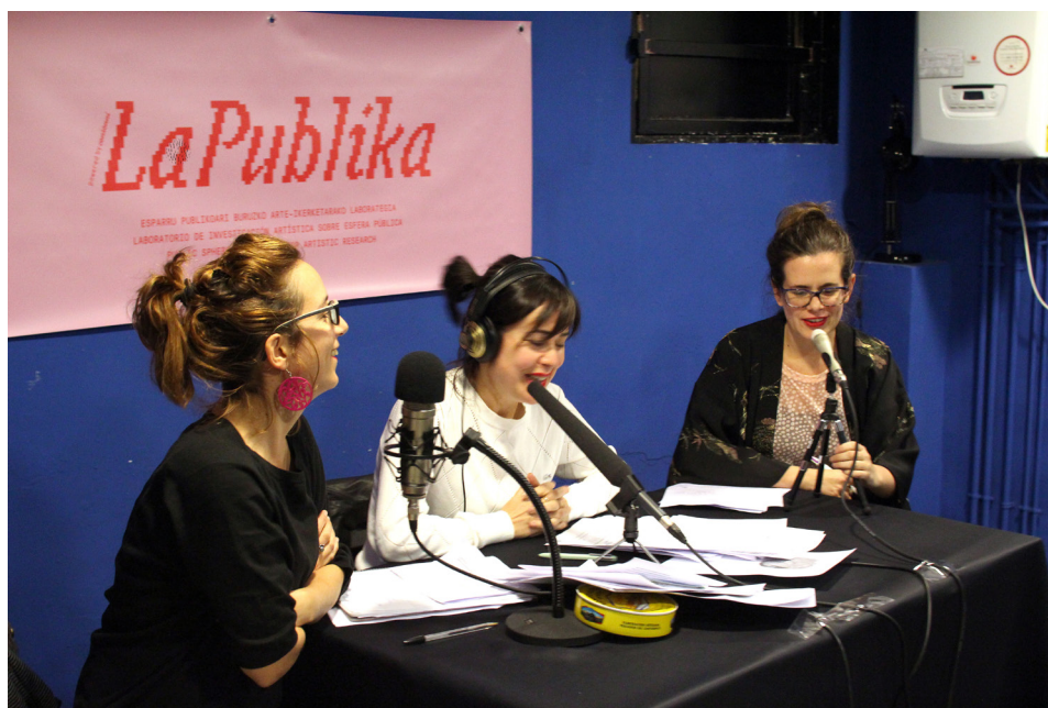
Irudia – Consonnin egindako Irrati-magazina. Egilea – Consonni