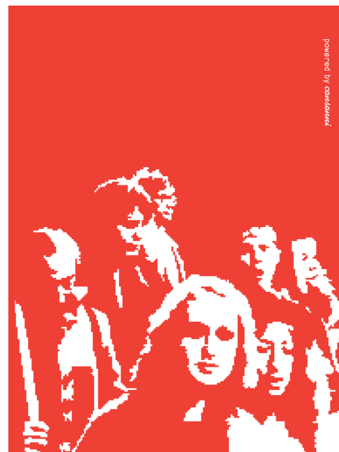
Irudia ~ LaPublikako irudiak. Egilea ~ Eider Corral

Lefort-ekin bat gatoz (2004), esaten baitu gaur egun desagertzen ari direla bizitza sozialari buruzko ziurtasun asko. Gatazka- eta krisi-egoerak mehatxu gisa ikusten dira, arriskutsu status quo -arentzat. Deutschek nabarmentzen duenez, demokrazia moderno mendebaldar liberala, parte-hartzearen printzipio ideala ordezkatu baitzuen errepresentazio eta ordezkartzaren bidez, bizitza politikoaren ziurgabetasuna estaltzen duen lema bat da, gatazka «hauspotu» beharrean gatazka «baretuko» duten prozedurak txertatzen baititu. Lehenengo zailtasuna: boterea herritarrengandik dator, baina ez da inoren jabegoa. Hortik abiatzen da asmakizun demokratikoetako bat: espazio/esparru publikoa , bitartekaritza hori konpondu nahi duena (edo ez).