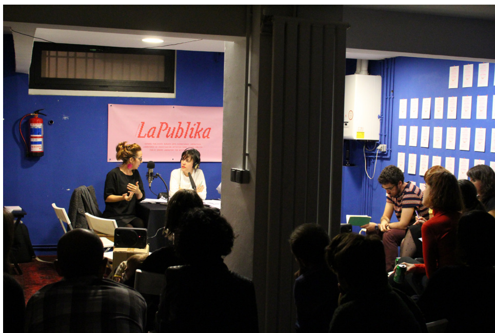
Irudia ~ Consonnin egindako Irrati-magazina. Egilea ~ Consonni