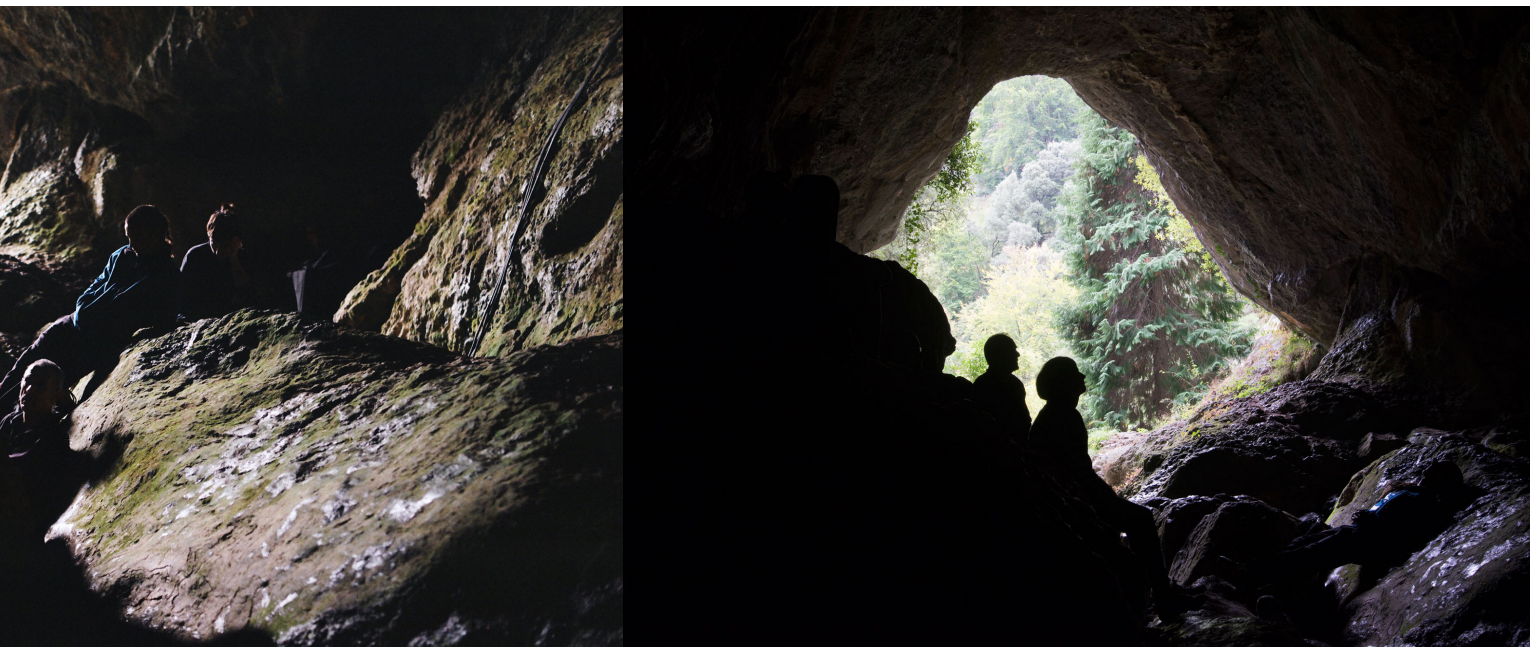
Irudia ~ Gerard Ortín artistaren TRABESKA ekintza artistikoa. Egilea ~ Mirari Echavarri

horretan, arte-praktikak ez zaizkio esparru publikoari lotzen aurrez existitzen ziren entitate gisa, aurrez ezarritako lengoia eta sistema gisa, baizik eta «ekintza politikoan parte hartzen» dutelako (Deutsche, 2008: 23). Alegia, publiko bat osatzen dute, gai komunei buruzko eztabaida bat deituz.