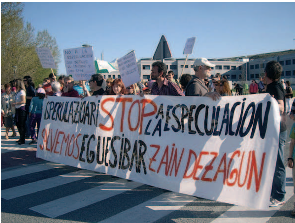
Iruñerriko Eguesibarreko hirigintza-plangintza berriaren aurkako manifestazioa (Eguesibar Zain Dezagun, 2011).

Prozeduretan lurralde-eragile bakoitzak eskuratu duen intzidentzia-gaitasunari dagokionez, nabarmena da planteamenduetan oso aldaketa gutxi egiten dela instituzioetatik kanpo dagoen erantzun edo ordezeko aukera bat dagoenean.