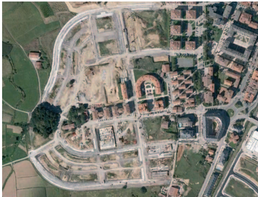
1.1 irudia: Gemikako Santa Luzia auzoa