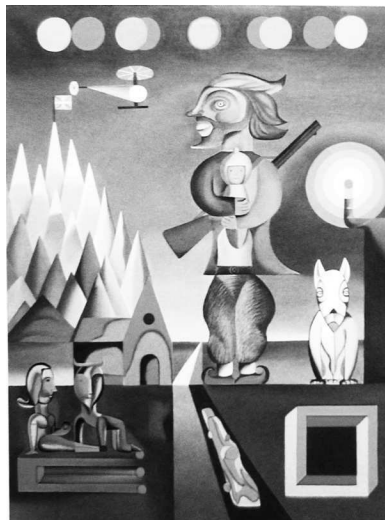
Mendiko heroia (1997)

Nire inguruan asko erabiltzen ziren elementuak dira, transbanguardiak eta neoespresionismotik jasotako elementuak, batez ere lehenengotik. Hala ere, huraxe zen erakusten zen artea (La Caixako erakusketakoa). Aldi berean, mundu osoan zehar artista asko zebilen lanean, eta ezin da haien lana mespretxatu. Bestelako berrikuste sakonago batek jende askoren lana identifikatu eta kokatuko luke.