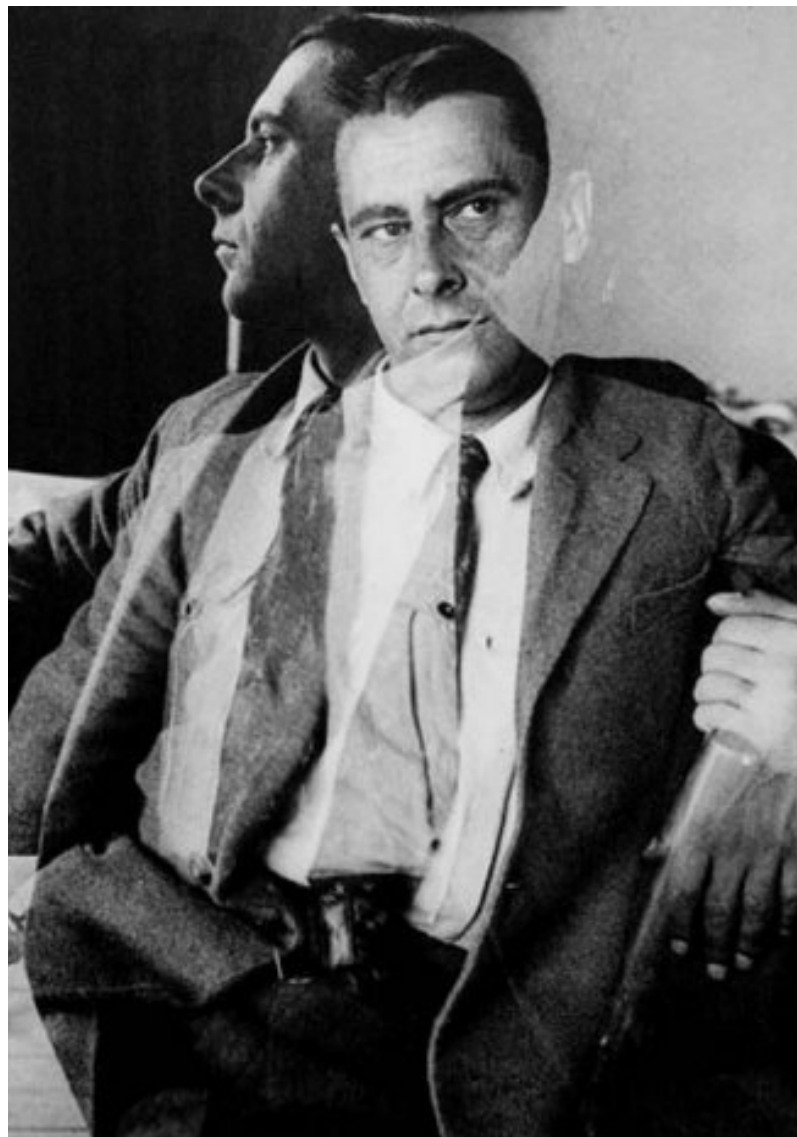
Irudia - Rodchenko.