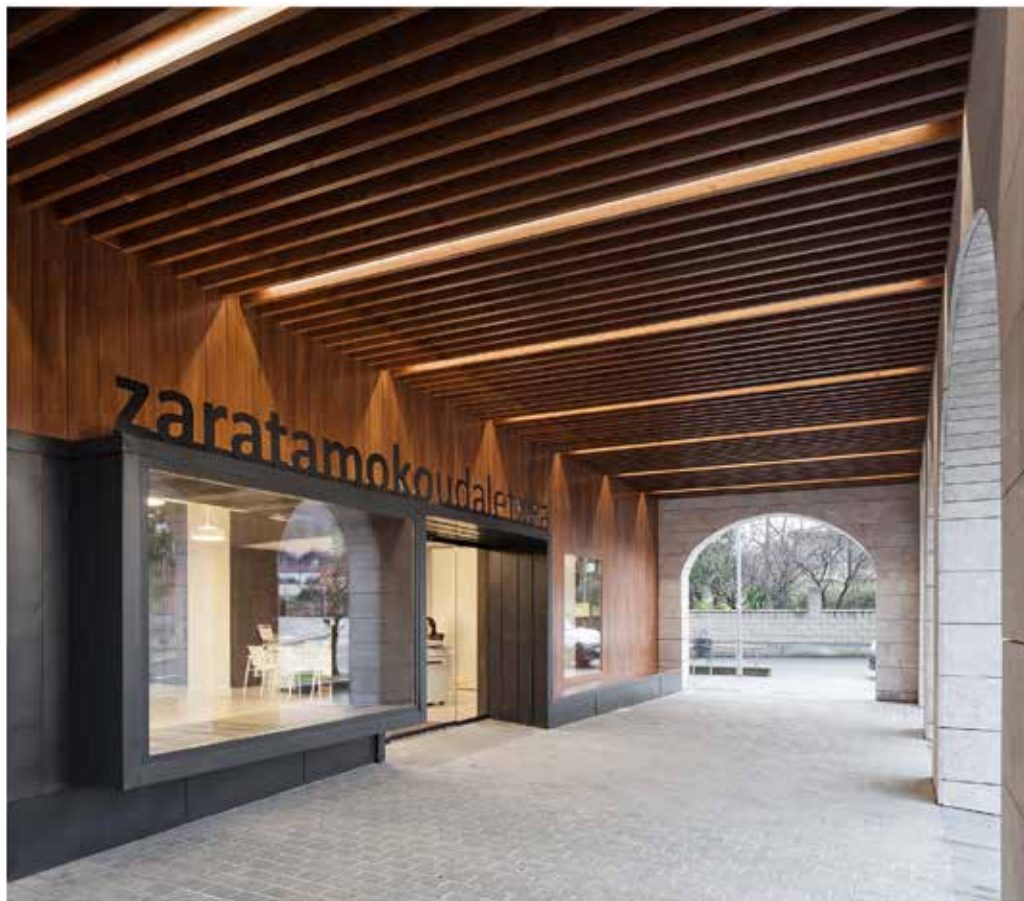
Irudia ~ Udaletxeko sarrera nagusia eta arkupea. Egilea ~ Pedro Pegenaute.