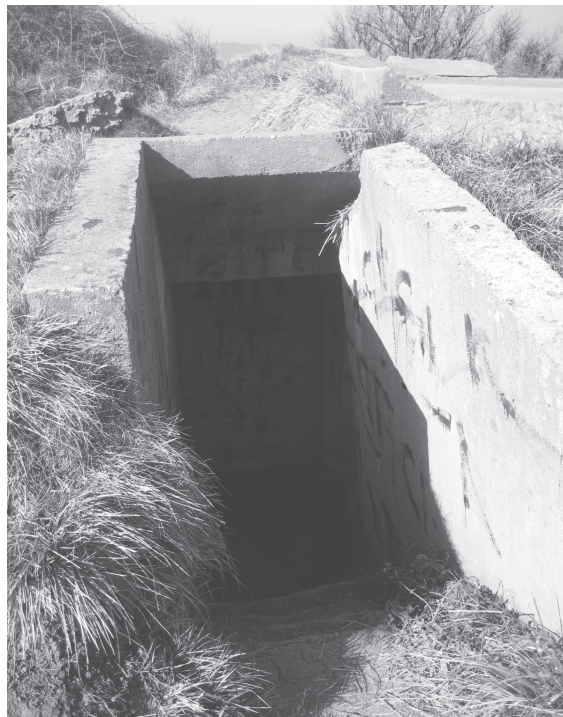
Hendaiaiko kostaldea zipriztintzen duten bunkerretariko baten irudia.

“Haurra nintzelarik, Orio nire jaioterrian, nire aitona hondartzara eramaten gintuen. Nik, han bertan, hondartzaren barnealdean zuden hondar zulo batzuekiko sekulako erakarpena nabaritzen nuen. Bertan sartu eta ezkutatzeko nuen neure burua, etzanda, gainean agerian neukan zeru zati erraldoiari begira geratzen nintzen, nire aldameneko guztia desagertzen zen bitartean. Sakonki babesturik topatzen nuen neure burua” (1) Sentsazio hori da hain zuzen ere gure kostaldeko edozein bunkerretako barnealdetik, zeruertzari so geratzen garelarik, nabari dezakeguna.