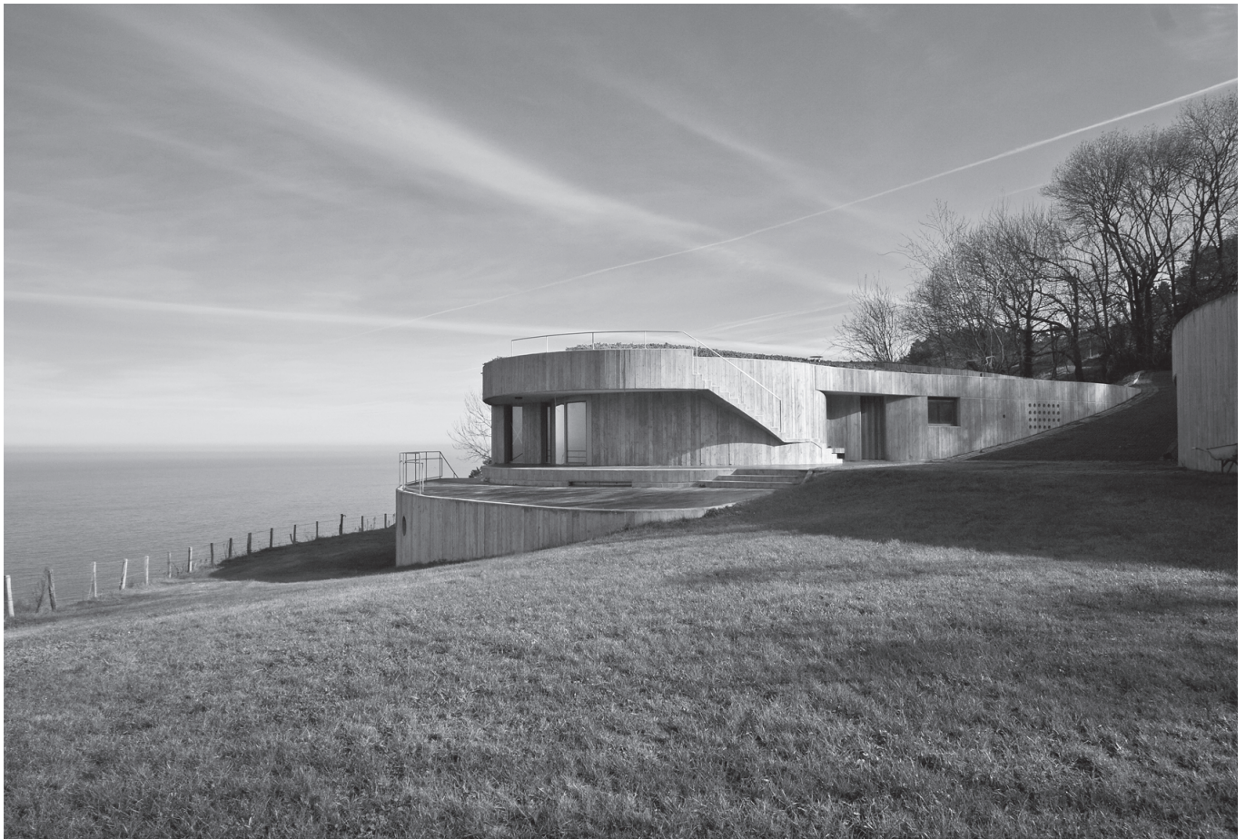
Peña Ganchegui & Asociados estudioaren Urrezkoenea etxearen kanpoko argazkia.