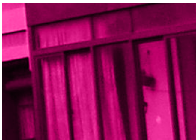
Plaza de los Tres Pilares eta Cantaloja plaza.