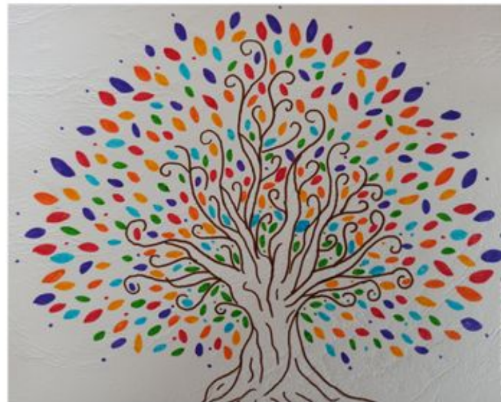
Egilea: Ahoia Idoloak Uzkandun